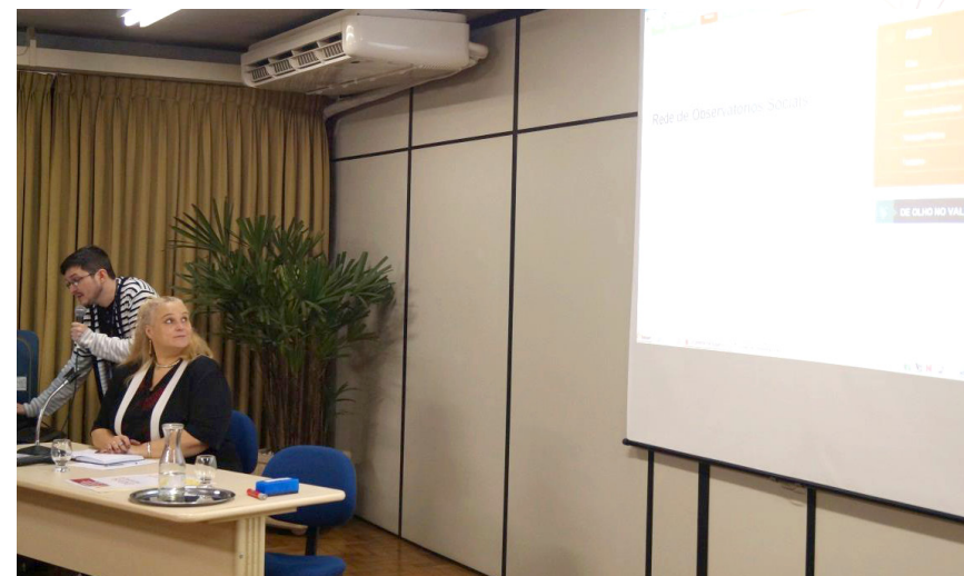
Lançamento das produções dos Observatórios.