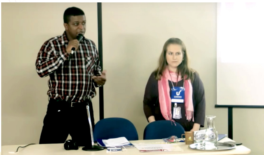
Roda de conversa dos Observatórios Sociais.