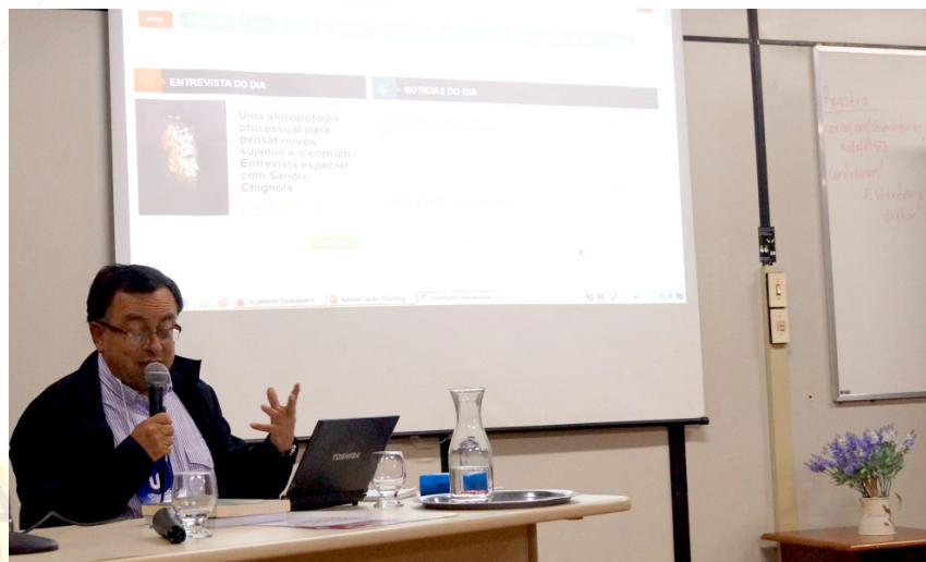
Conferência de abertura.